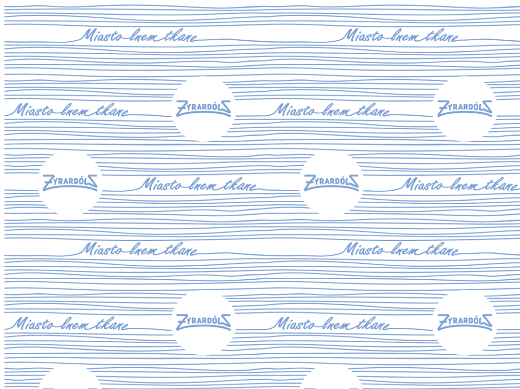
Plik graficzny 1. Pełny wzór tkaniny